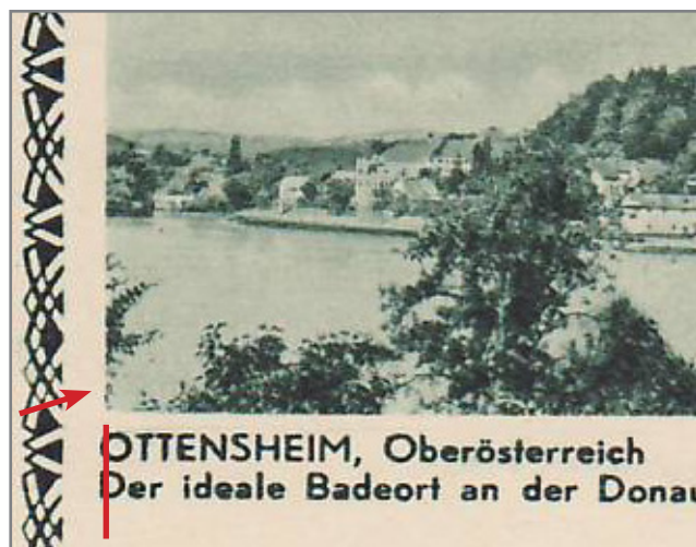
i041-16 geringfügig schmaleres Bild