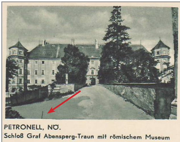
i007-23 mit senkrechtem Strich über dem L

Nach einem entsprechenden Hinweis von Ing. Nast habe ich mir die Karten i007-23 und i010-26 noch einmal genauer angesehen. Die beiden Karten lassen sich wie unten gezeigt unterscheiden. Herr Nast hat dieselben Unterschiede bei verschiedenen Karten festgestellt, so daß sie nicht zufällig, sondern systematisch entstanden sind: