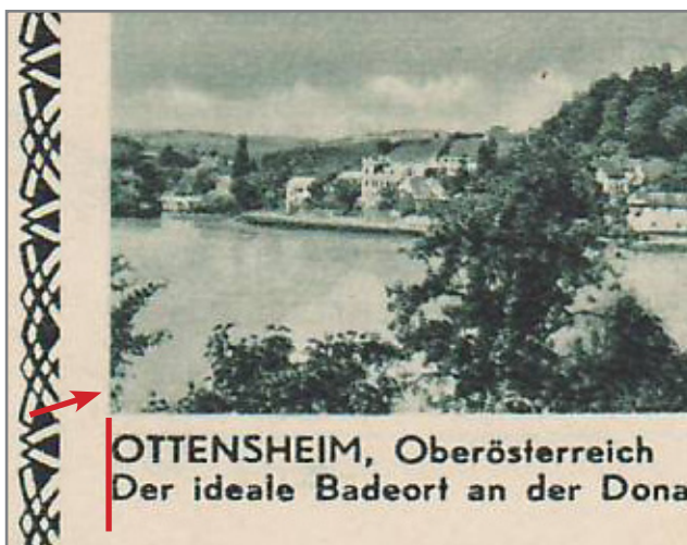
i037-24 geringfügig breiteres Bild

Auch die Karten i037-24 und i041-16 wurden nochmals begutachtet, auch hier kam der Hinweis von Ing. Nast, der auf die minimal unterschiedliche Stellung des Textes hinwies. Es besteht ein minimaler Unterschied. Man sieht an den Zweigen links, daß der Bildausschnitt bei 37-24 geringfügig größer ist. Das bedingt auch, daß die Beschriftung rechts vom Bildrand beginnt. Bei 041-16 ist der Bildausschnitt kleiner und die Beschriftung beginnt minimal links vom Bildrand.